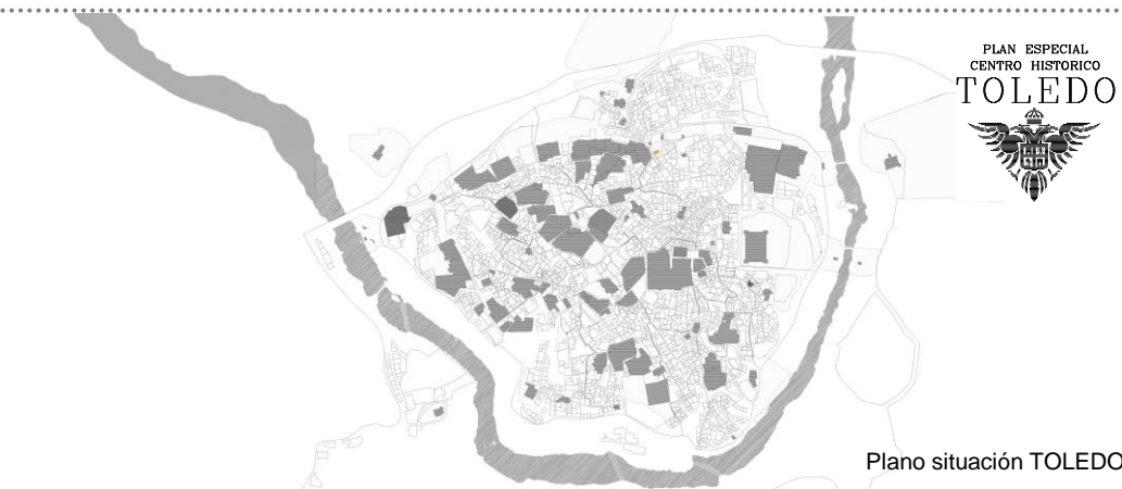
Plano situación TOLEDO