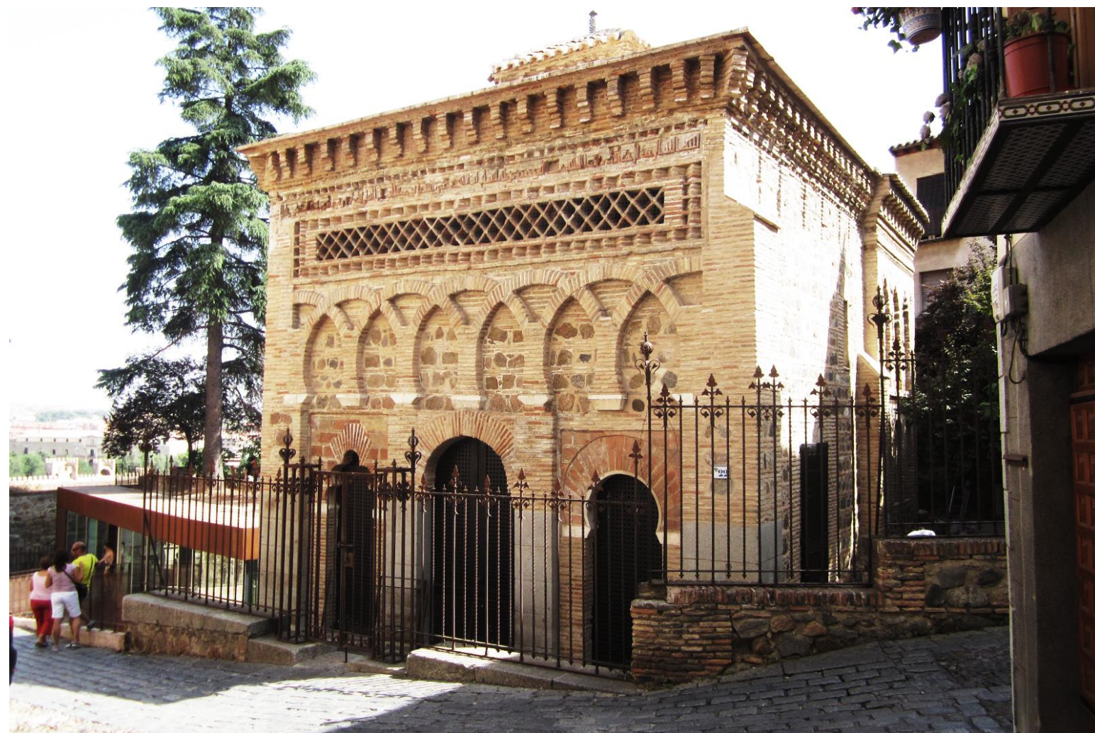
VISTA EXTERIOR DE LA MEZQUITA