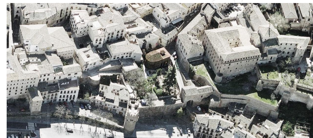
Vista aérea del conjunto