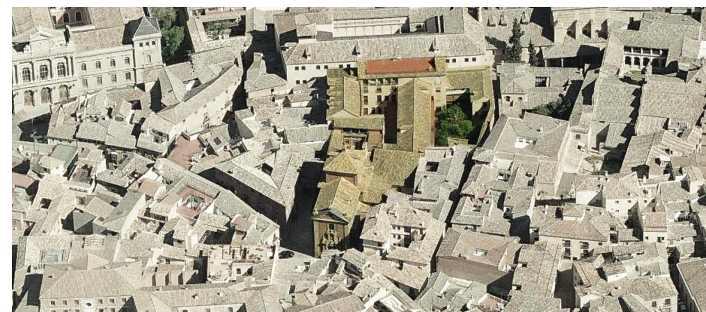
Vista aérea del conjunto