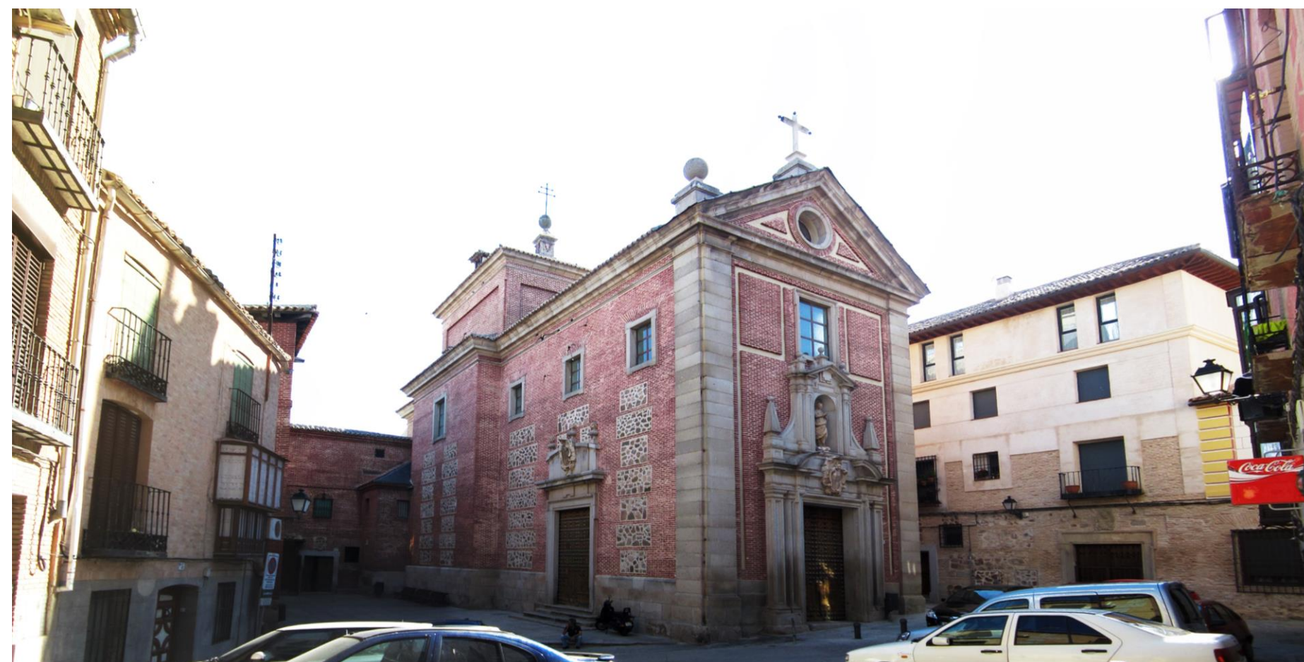
VISTA DESDE PLAZA CAPUCHINAS