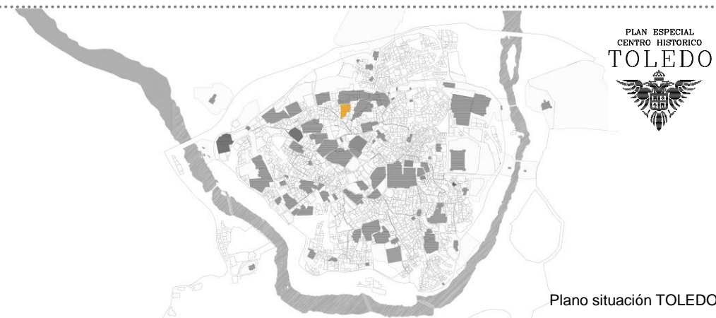
Plano situación TOLEDO