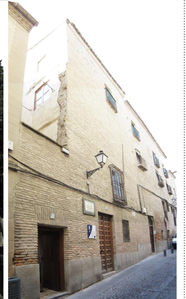
VISTA DESDE C. ESTEBEN ILLÁN