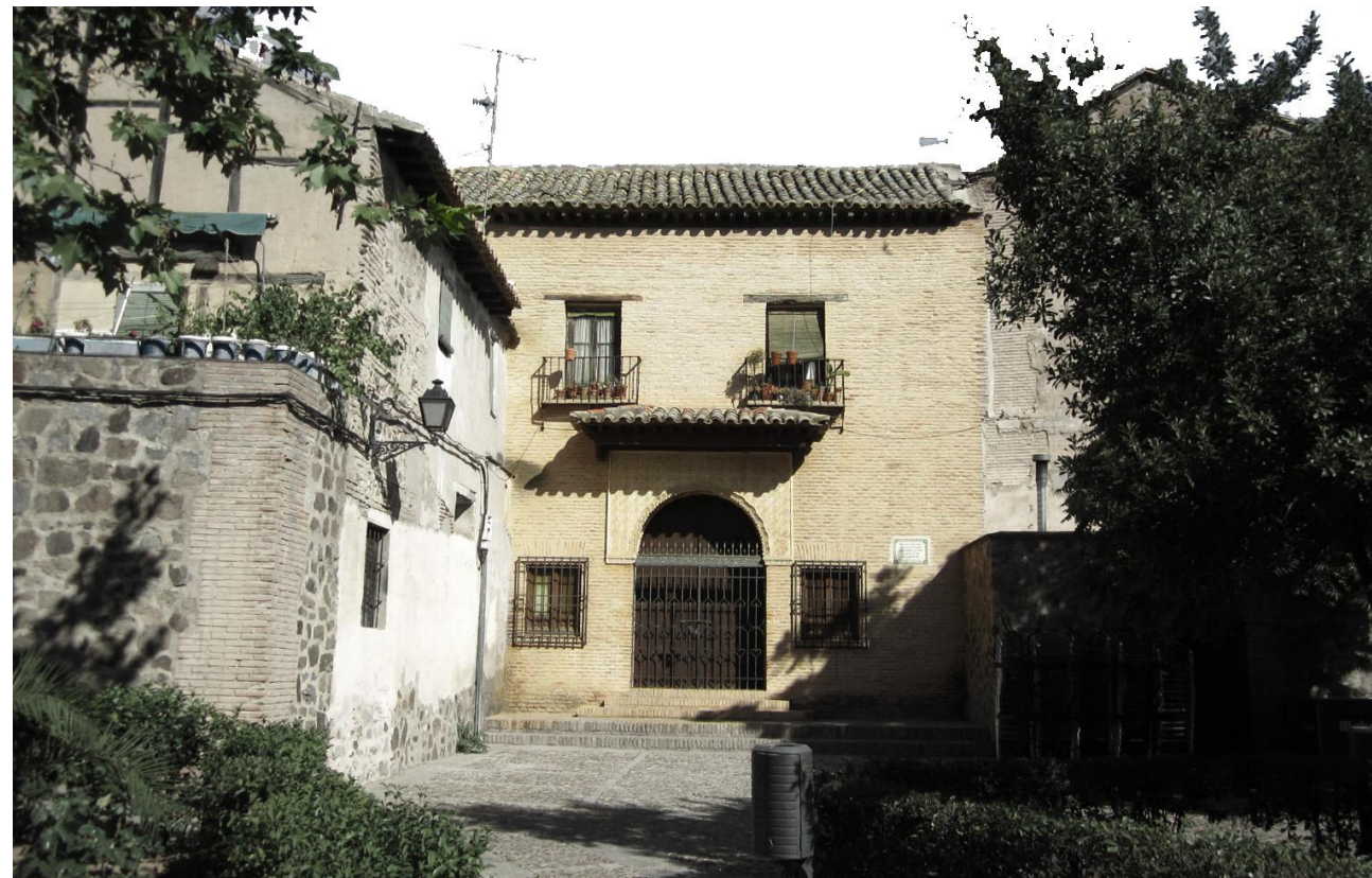
VISTA DESDE LA PLAZA DE SAN ROMÁN

ENTORNO INCOADO DOCM 29 / 11 / 1996 CADUCADO