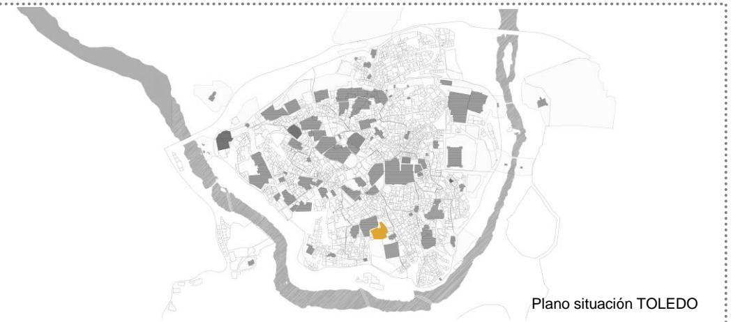
Plano situación TOLEDO