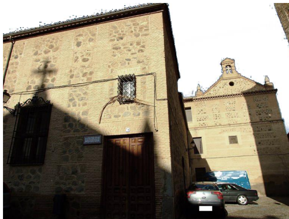
VISTA DEL SEMINERIO

ENTORNO INCOADO DOCM 20 / 12 / 1996 CADUCADO