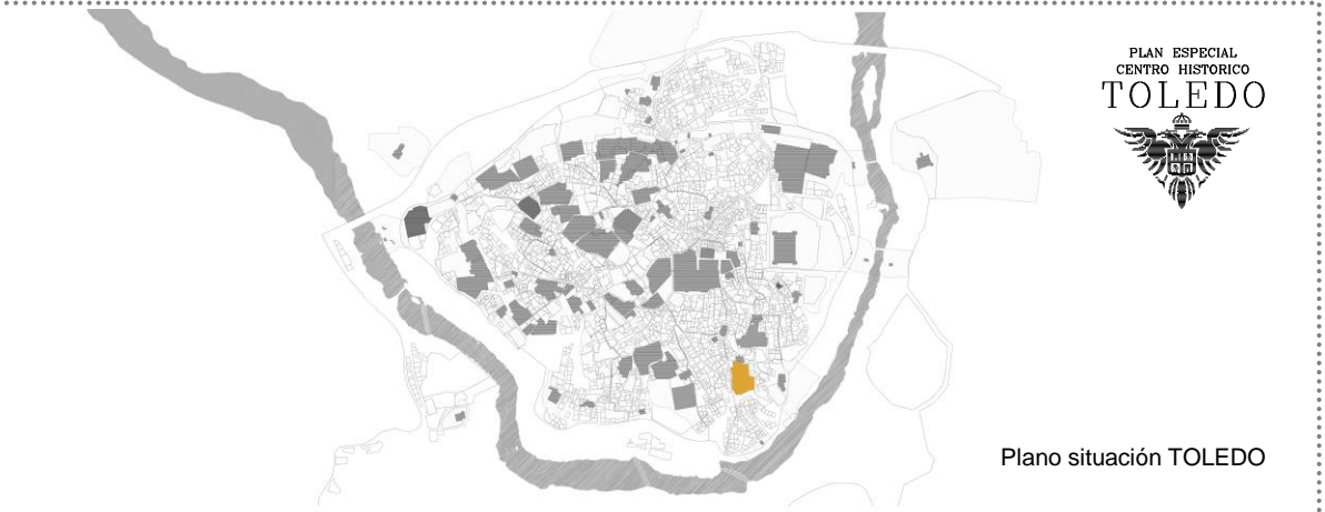
Plano situación TOLEDO