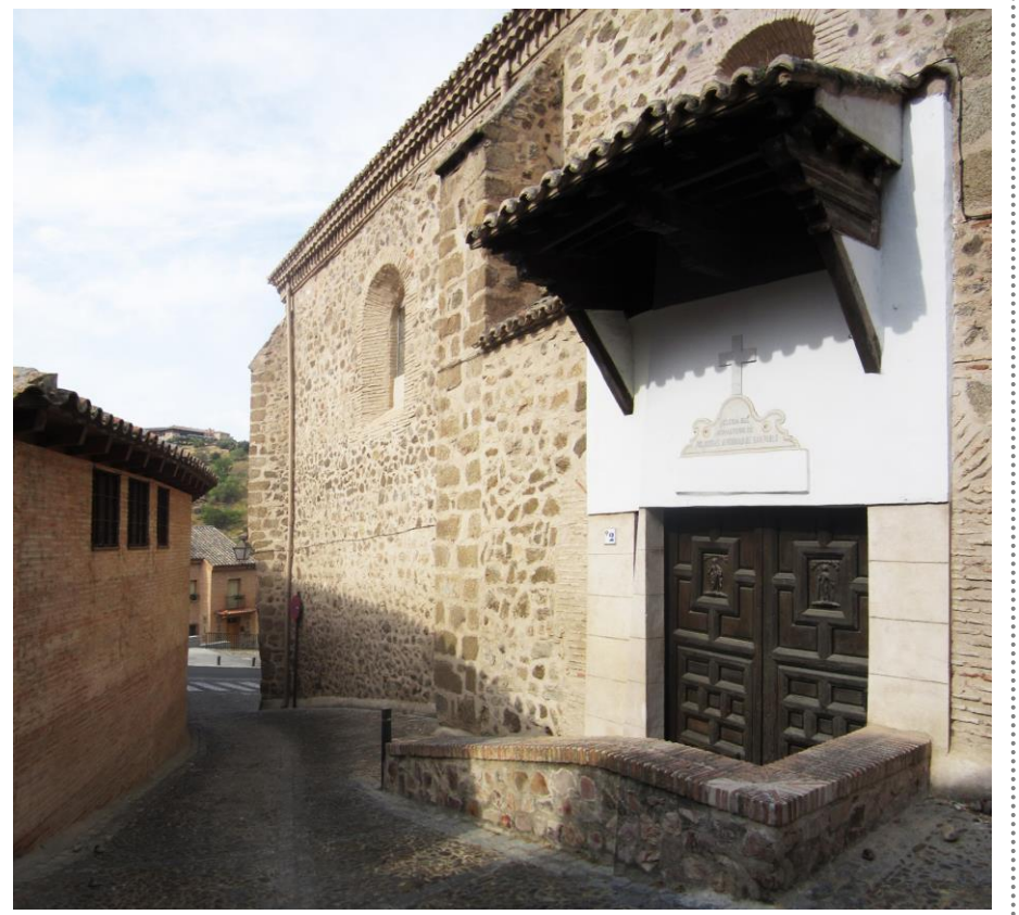
VISTA ALZADO PRINCIPAL IGLESIA