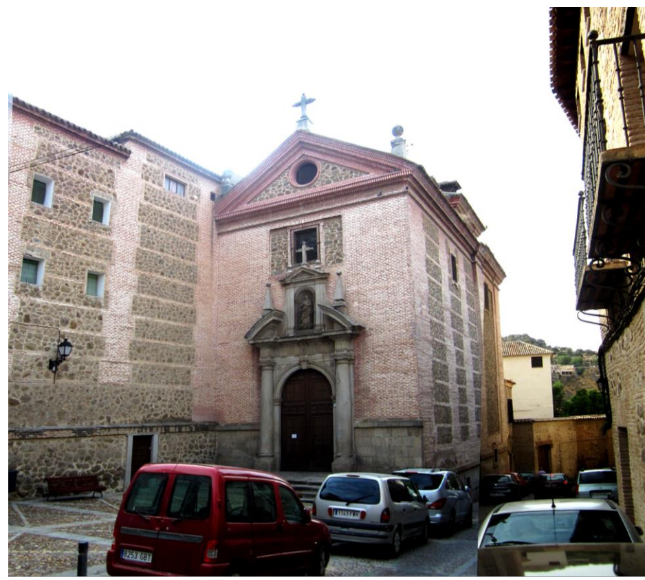
PARTE TRASERA CONVENTO

MONUMENTO DECLARADO DECRETO 44 / 1999 DOCM 07 / 05 / 1999