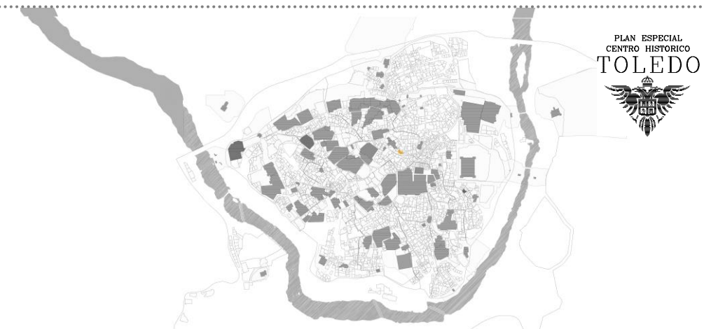
Plano situación TOLEDO