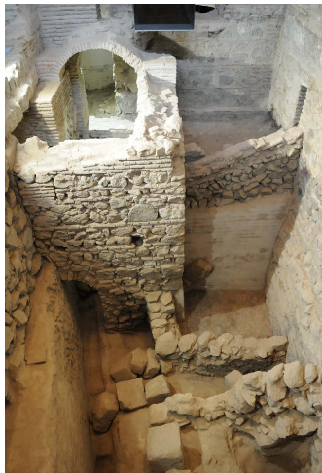
VISTA DEL INTERIOR