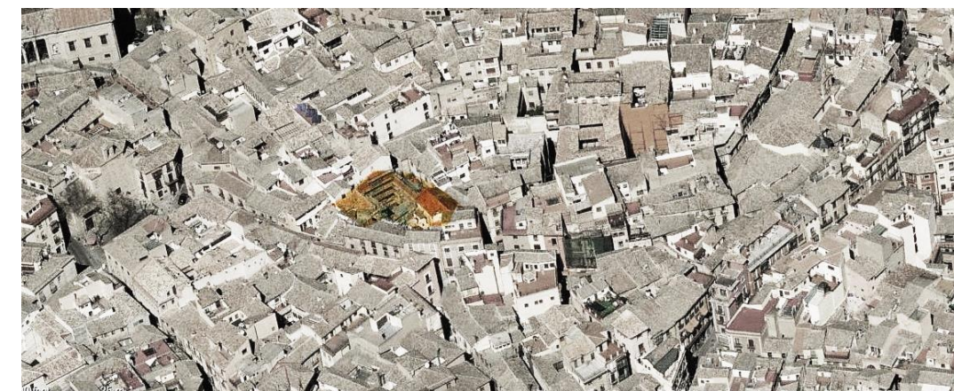
Vista aérea del conjunto