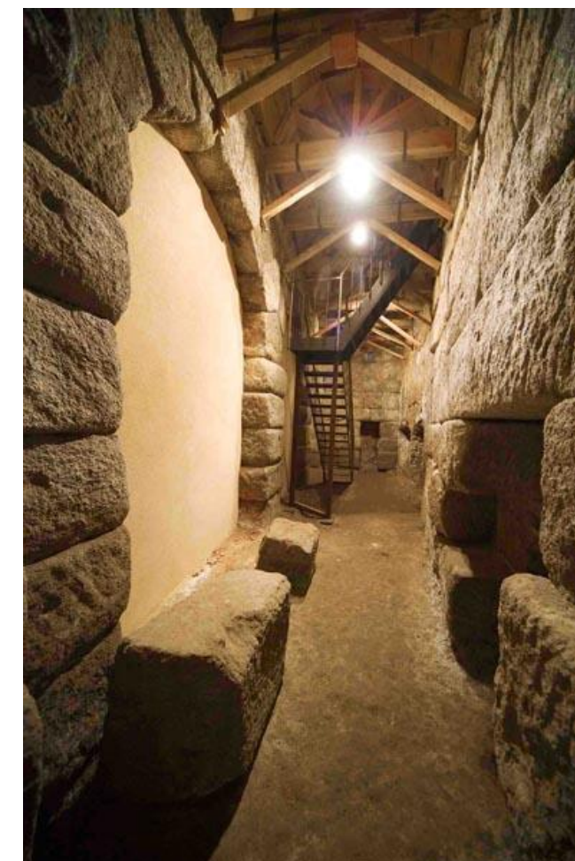
VISTA DEL INTERIOR