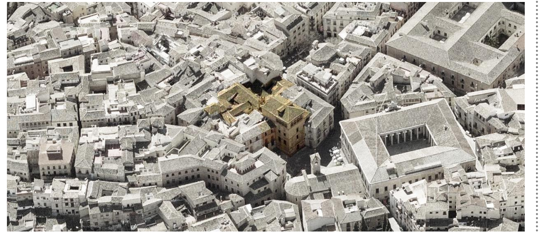
Vista aérea del coniuento