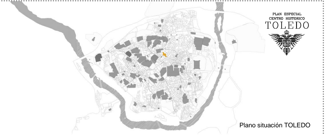
Plano situación TOLEDO