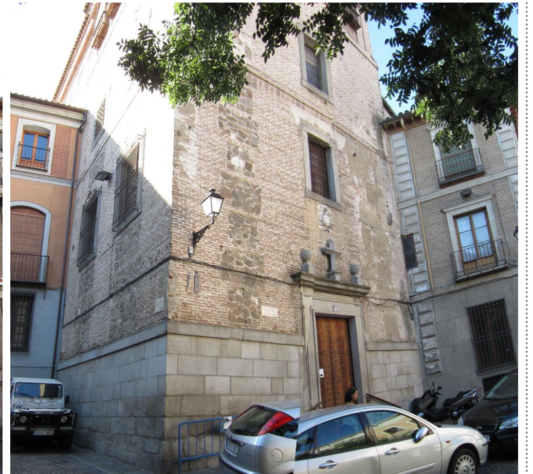
VISTA DEL ALZADO PRINCIPAL