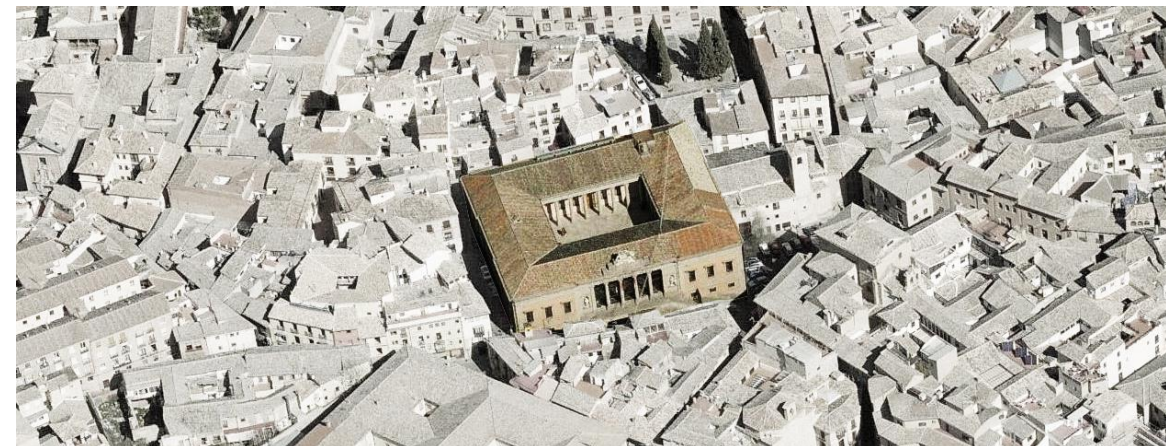
Vista aérea del conjunto