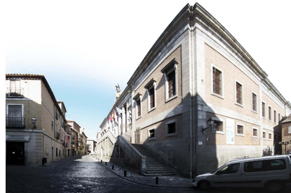
VISTA DEL ALZADO PRINCIPAL

MONUMENTO DECLARADO DECRETO 09/1998 DOCM 20/03/1998