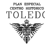
Plano situación TOLEDO