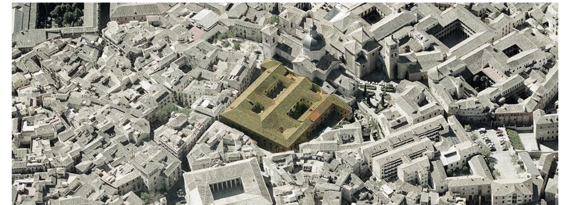
Vista aérea de los dos inmuebles