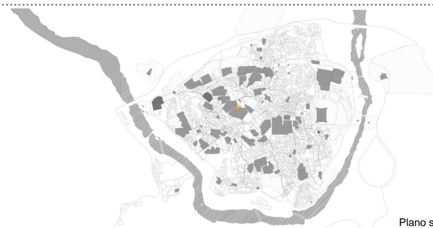
Plano situación TOLEDO