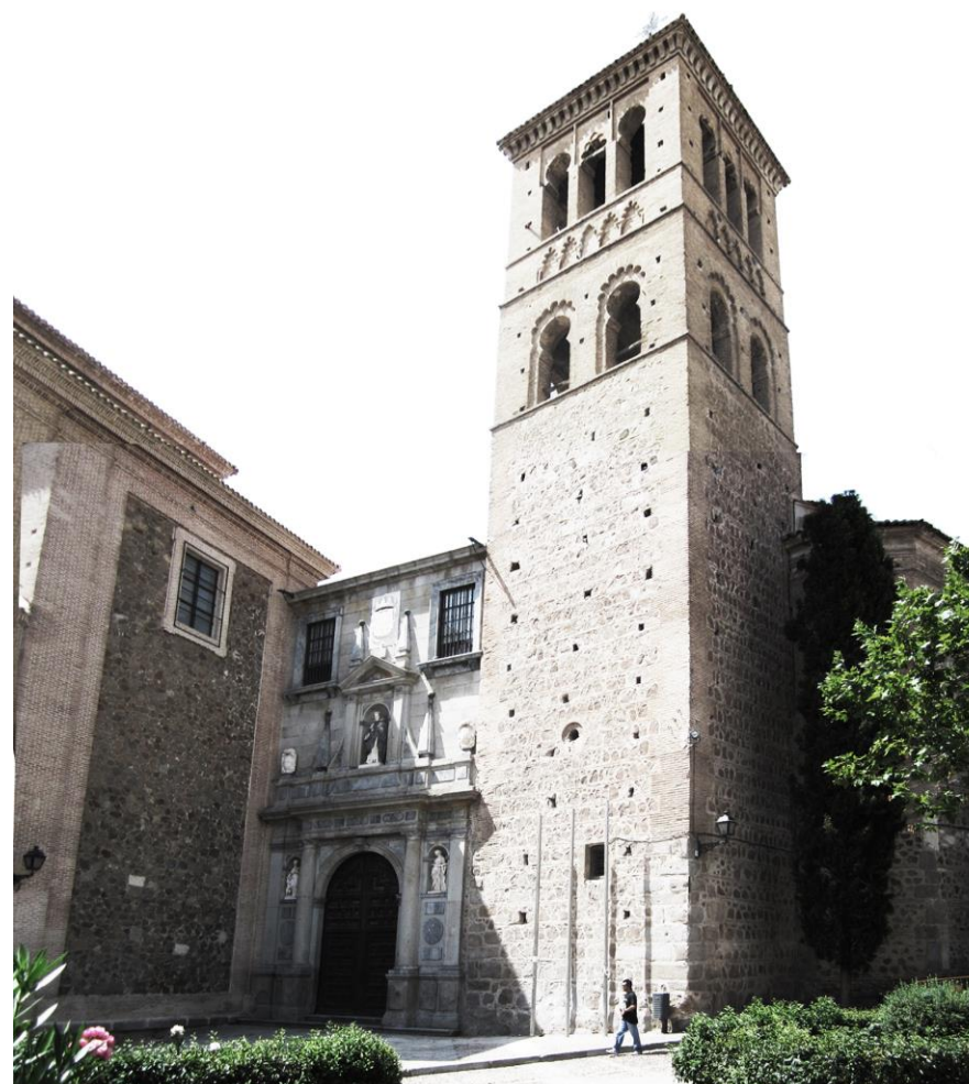
PORTADA DE LA IGLESIA

MONUMENTO DECLARADO DECRETO 04 / 06 / 1931 ENTORNO PROTEGIBLE DECRETO 107/2001 DOCM 13/04/2001