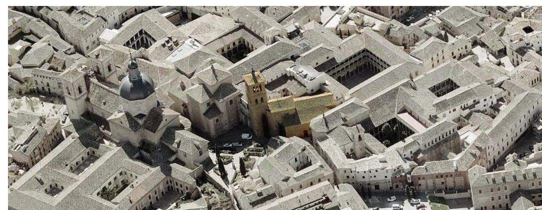
Vista aérea del conjunto