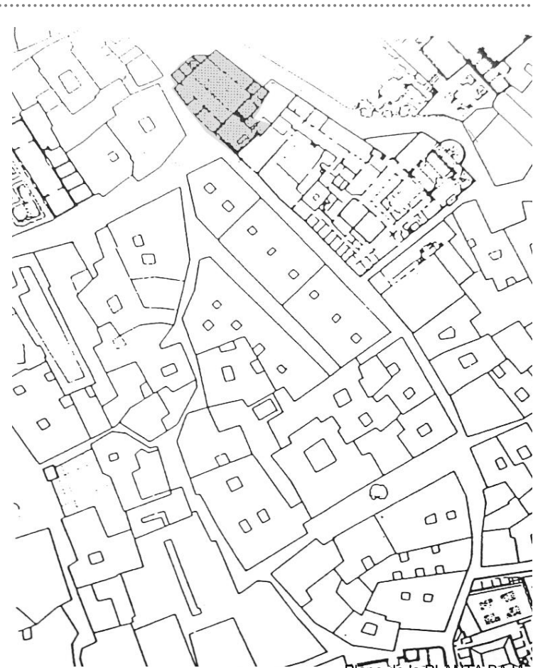
Plano de la PLANTA BAJA