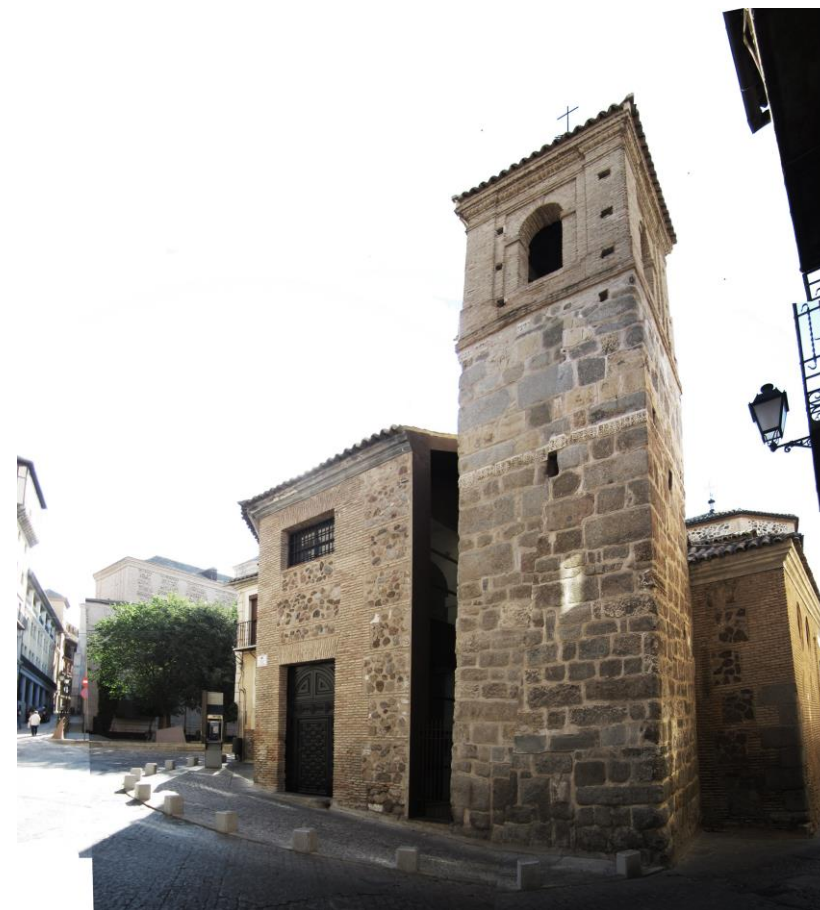
VISTA ALZADO PRINCIPAL

3.1. TIPOLOGIA Mezquita hispano-musulmana, 3.2. DESCRIPCION El edificio es de planta basilical, con tres naves de desigual tamaño, ligeramente más alta la central, que las laterales. 3.3. CONSTRUCCION Los muros de esta capilla son de cantería con cadenas de piedra en la mitad inferior y de ladrillo en la superior. Recientemente se ha efectuado una actuación rehabilitadora que ha dejado al descubierto las trazas y diversos enterramientos en el subsuelo.