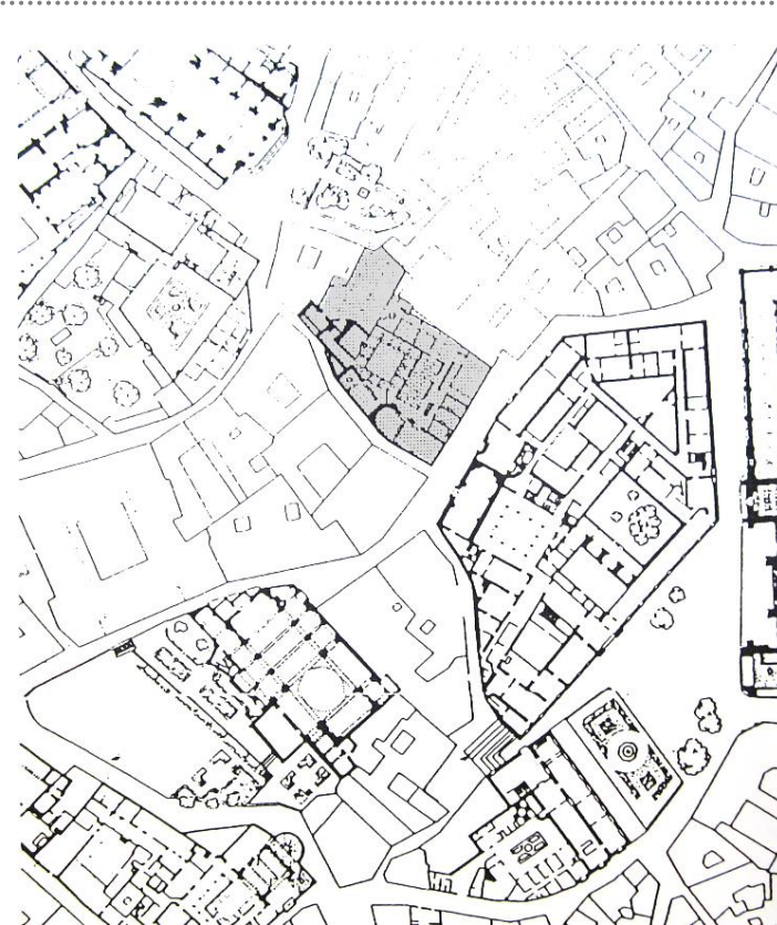
Plano de la PLANTA BAJA

LEY 16/1985 BOE 29/06/1985 BIC R-1 AR-0000050