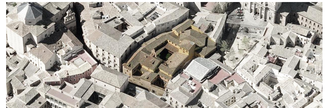
Vista aérea del conjunto