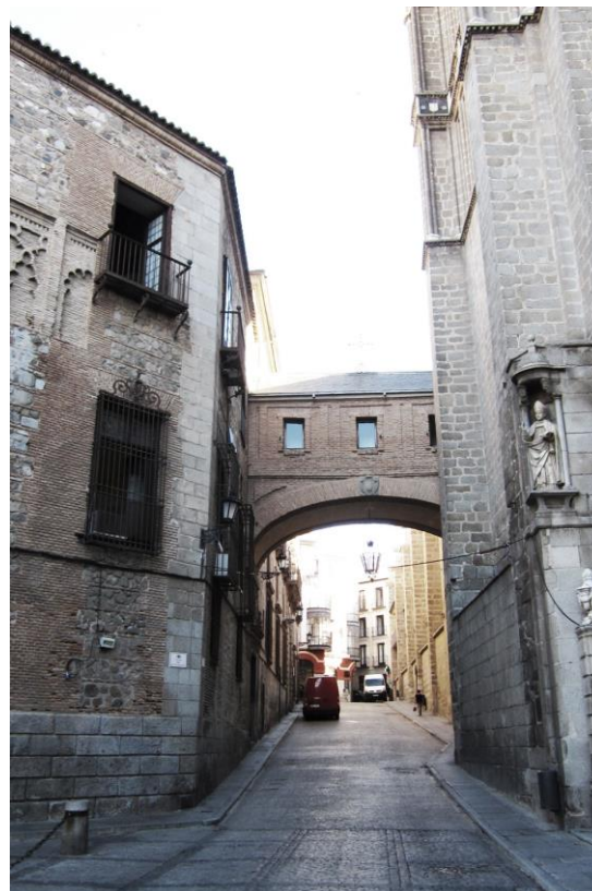
UNIÓN CON LA CATEDRAL