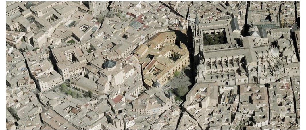
Vista aérea del coniuento