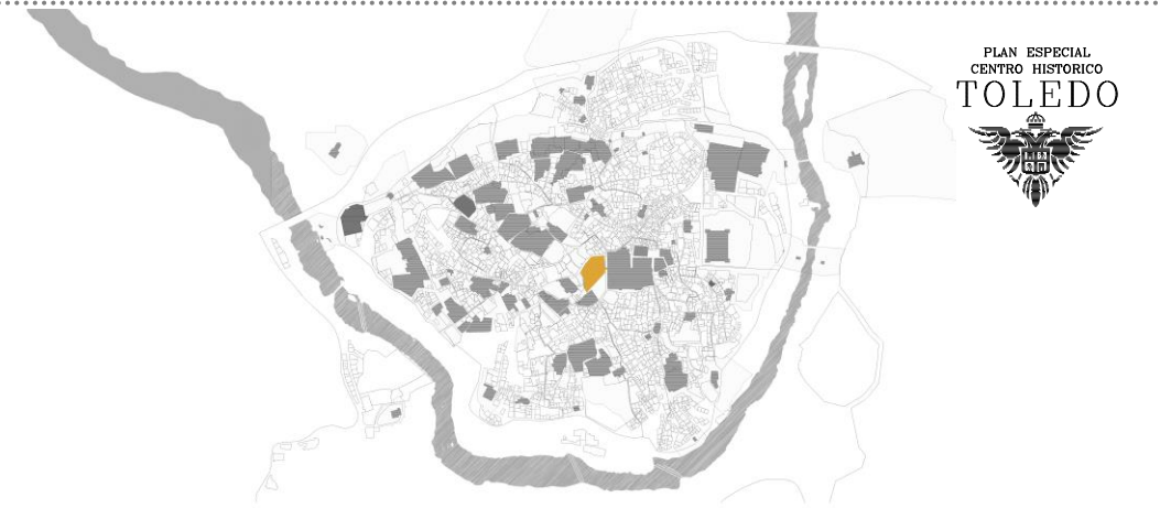
Plano situación TOLEDO