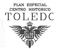
Plano situación TOLEDO