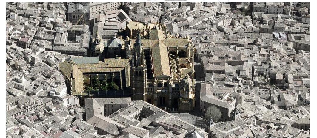
Vista aérea del conjunto