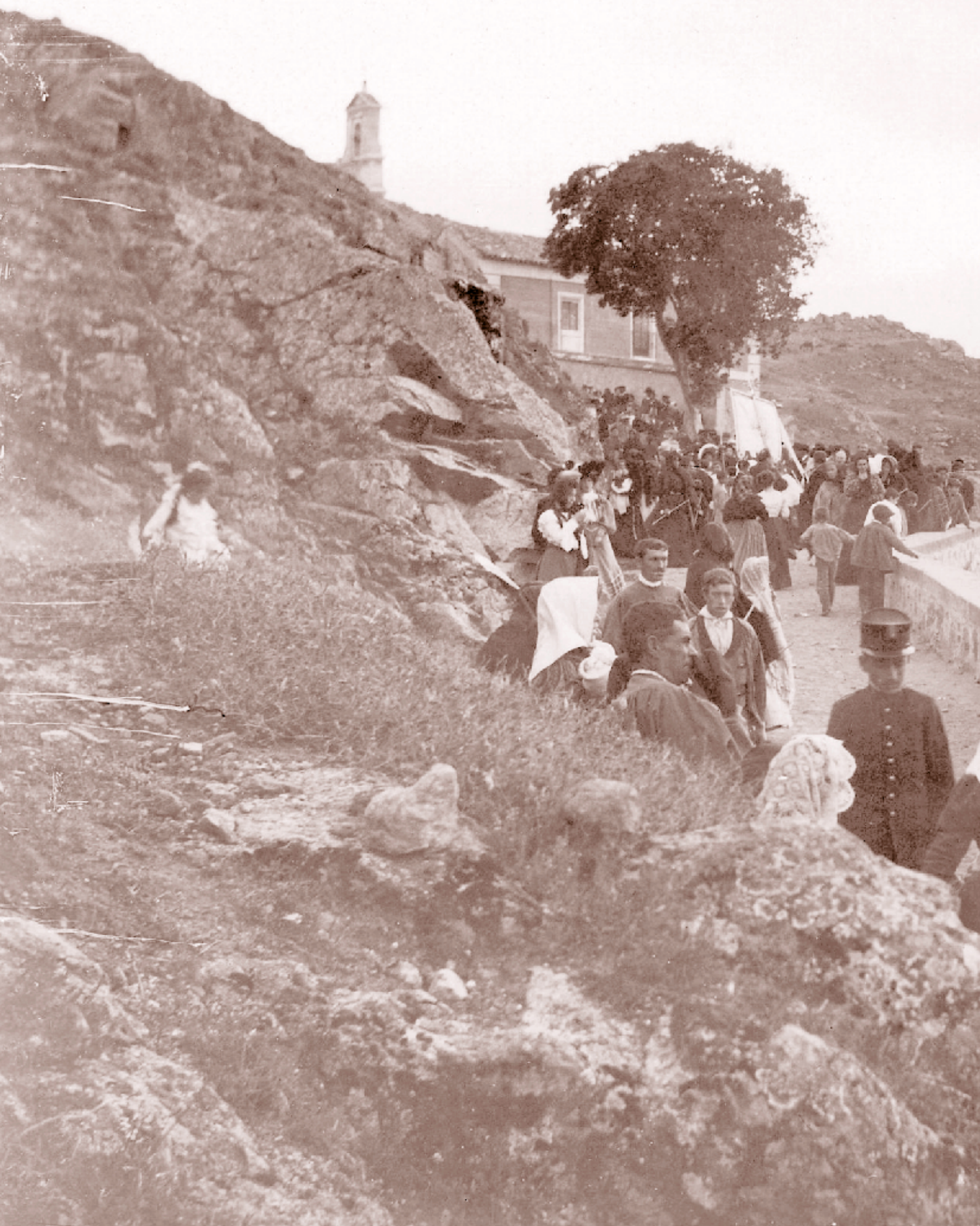
[ca. 1920]. Toledo.-Romería de la Virgen del Valle.