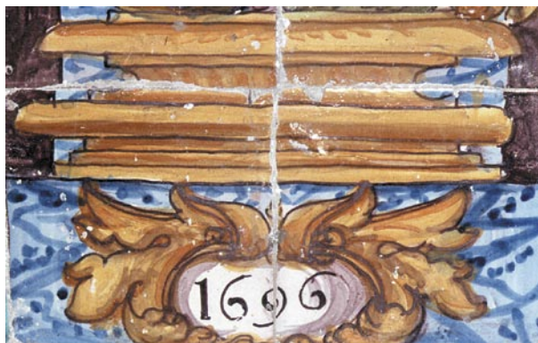
Detalle de los zócalos de la Sala Capitular Baja. En la imagen vemos el plinto sobre el que se asienta uno de los guerreros en el que se ve el año de la realización de la obra, 1696, y que según algunos autores será «la última gran obra de la cerámica talaverana».