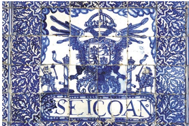
Paneles de la Galería Baja, en técnica pintada sobre cubierta estannífera. Son los restos de unos zócalos o arrimaderos que debieron estar colocados en alguna sala del Ayuntamiento. Debe ser obra de los alfares barrocos toledanos.

Tanto los azulejos de relleno como las cenefas están realizadas con la técnica de estarcido, para lo que el alfarero coloca sobre la pieza bizcochada y bañada en blanco, un papel o cartón perforado con las líneas principales del dibujo y golpea suavemente con una muñequilla llena de polvo de carbón vegetal u otra materia que deje la huella del diseño. A continuación se perfilan los contornos y se rellena de co-