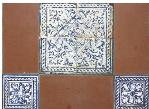
Detalle de la solería de la Sala Capitular Baja. Vemos la composición del diseño a base de cuatro azulejos de cuarto que en sus extremos diagonales llevan un sólo azulejo de dibujo completo. Todos están realizados sobre cubierta cruda y pintados en color azul pálido, imitando el cromatismo de la porcelana. Muchas de estas piezas no son originales sino que han sido realizadas por la Escuela Taller de Restauración del Ayuntamiento.