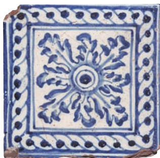
Azulejo del soldado de la Sala Capitular Baja. Desde la época medieval en Toledo se realizaron infinidad de suelos con azulejos de cerámica imitando el efecto de las alfombras. Esta pieza lleva un dibujo completo con una gran roseta central de ocho hojas carnosas de tipo acanto. Lleva un doble fileteado para enmarcarla y en su interior un trenzado de dos ramales. Técnica sobre cubierta estannífera.