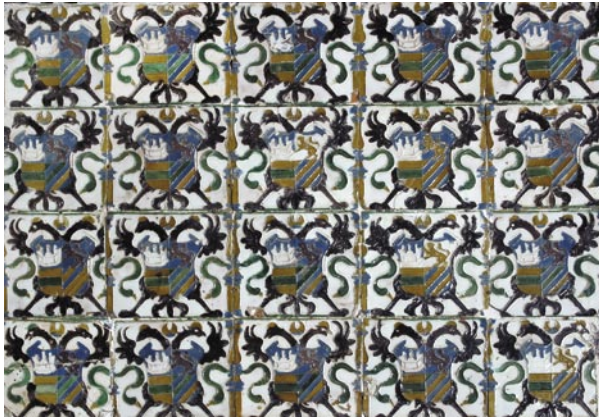
Panel de azulejos de la Galería Alta con el escudo de Carlos V; realizados para el Alcázar en 1550. Hechos en técnica de «cuencas o arista» que consiste en presionar el barro todavía fresco sobre un molde de escayola en el que se ha realizado un dibujo rebundido. Esto deja unas aristas en relieve que sirven para evitar que los colores se mezclen durante la cocción; deriva de la técnica de «cuerda seca» de origen islámico.

muestra los siguientes cuarteles: el primero, de Castilla, en plata (blanco) sobre campo de azul. El segundo cuartel es de León, en esmalte cárdeno y campo también de azul, (excepto tres ejemplares del panel que llevan el león melado sobre campo blanco). El tercer cuartel va terciado en faja (de Austria), con ésta en sínople (verde) y campo de oro (melado). El cuarto, de Borgoña Antiguo, con barras que debían ser bandas, debido a una equivocación del alfarero al grabar el molde del revés; está coloreado caprichosamente, variando mucho de unos azulejos a otros aunque en general la mayoría lleva azul y oro alternos, y por otro error en la aplicación del esmalte, una parte superior en sínople que está en casi todos. A los costados dos medias columnas de Hercules que llevan cintas o filacterias alrededor de ellas.