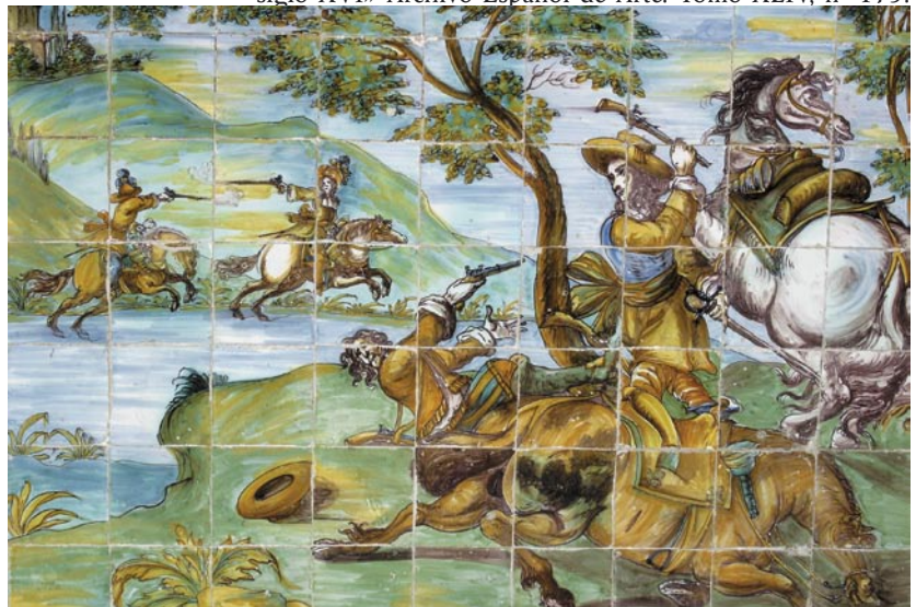
Zócalo de la Sala Baja. Enmarcada por pilastras con las figuras de guerreros, esta historia muestra dos momentos de la lucha colocados en composición diagonal. Los personajes van armados con pistolas y llevan indumentarias de su época. La escena principal está delimitada por dos árboles de copas superpuestas, del mismo tipo que los de la serie policroma, con abundante uso del verde.

COLL CONESA, J.: «Talleres, técnicas y evolución de la azulejería medieval». La ruta de la cerámica . Castellón 2000.