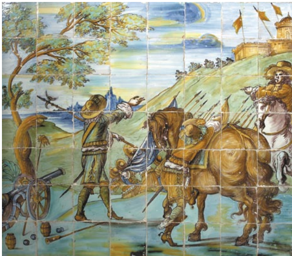
Zócalo de la Sala Baja. La vista de esta obra creaba la sensación de profundidad continua que hoy está interrumpida por el mobiliario que impide ver todas las escenas.

El precedente remoto es el famoso Marco Aurelio de Roma, escultura que ha sido el punto de partida de cualquier personaje que deseara ser trasunto del poder imperial. Las actitudes son variadas: luchan cuerpo a cuerpo, participan en una carga, un duelo, una parada... Muchas pueden relacionarse con grabados flamencos 31 como fuente de inspiración, costumbre muy extendida desde el siglo XVI y que utilizan casi todos los pintores y artistas españoles, algunos tan extraordinarios como Velázquez, quien no desdén este tipo de modelos para algunas de sus obras como por ejemplo «la fragua de Vulcano».