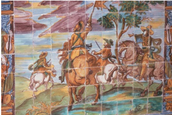
Zócalos de la Sala Baja. Los paneles presentan una variada iconografía con historias y personajes diferentes que se recortan sobre paisajes muy relacionados con los que aparecen en la «serie policroma» talaverana. Los personajes ecuestres guardan relación con los grabados tan utilizados del italiano Antonio Tempesta y, por tanto con los azulejos holandeses contemporáneos que tienen el mismo origen.

ciertos elementos como el casco o el escudo, por lo demás mantienen semejanzas con la imagen original.