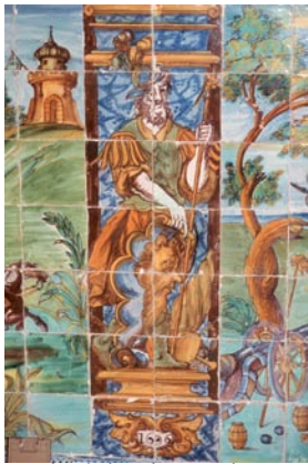
Zócalos de la Sala Capitular Baja. En técnica pintada sobrecubierta y policromados. Figura de guerrero de indumentaria clásica y aspecto manierista que sirve de separación entre las escenas de paisajes o batallas. Lleva en una mano un escudo con mascarón central, alabarda en la otra y casco plumado.