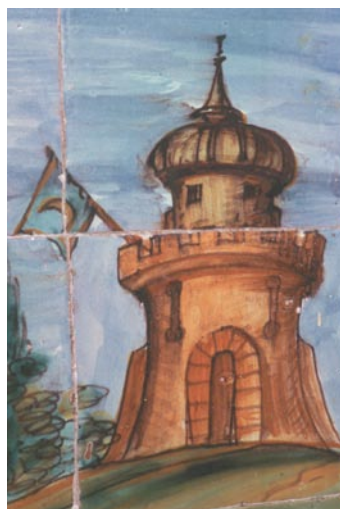
Detalle del zócalo y de una estampa flamenco grabada por Johann Sadeler (1550-1600) y conservada en la Biblioteca Nacional. En el grabado se ve un paisaje de fondo con arquitecturas diversas, una de ellas coronada por una bandera. Se aprecia cómo el pintor talaverano se inspira en este tipo de imágenes para realizar los fondos; el azulejo muestra un clásico castillo transformado en baluarte otomano mediante la adición de un cuerpo de remate acabado en una cúpula gallonada, y una bandera con la media luna.