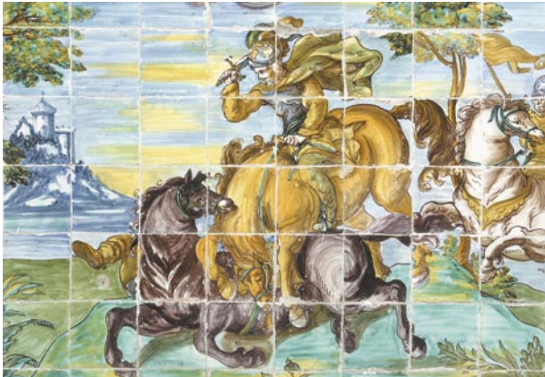
Zócalos de la Sala Baja. La escena es de gran dinamismo, utilizando una composición diagonal para las figuras que acentúa la tensión dramática de la escena. Técnica sobre cubierta con perfilado del dibujo en manganeso que da un tono negro amoratado. Se aprecia el paisaje de fondo en azul para dar impresión de lejanía. Los colores están tomados de la «serie policroma» talaverana. Escena con una figura a caballo, blandiendo una espada. La indumentaria está a medio camino entre lo clásico y la moda renacentista.