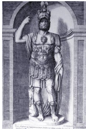
Grabado flamenco, obra de Jacobo Bos (1520-1560) de la serie «Speculum Romanae Magnificentiae». Se observan bastantes puntos de contacto con la imagen anterior. Los alfareros españoles se inspiraban en estampas y grabados para sus obras; éstos empezaron a difundirse a partir del Renacimiento.

de vajilla llamada, propiamente, «pólcroma».