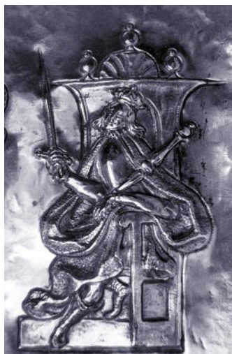
Detalles de las figuras de los reyes-emperadores.