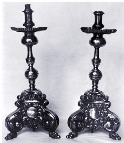
Fig. 1. Candeleros de altar. Madrid, 1702. Matías Vallejo.

Era hijo y hermano de otros dos plateros activos en Toledo llamados ambos Cristóbal de Ávila, pero se ignora en qué momento él mismo se inició en el arte. En febrero de