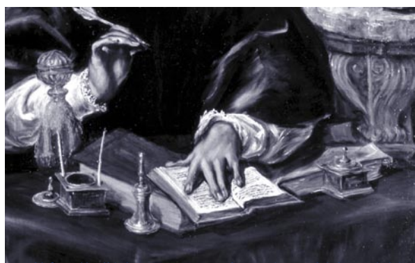
San Ildefonso (detalle), hacia 1600-1603. El Greco ( Hospital de la Caridad de Illescas ).