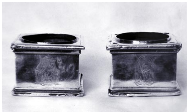
Tintero y salvadera. ¿Toledo?, antes de 1593.

La ausencia de marcas, así como la falta de noticias acerca de su hechura en la documentación consultada del Archivo Municipal, impiden asegurar la realización de estas piezas en Toledo y concretar la fecha en que fueron adquiridas. No obstante, creo que podrían ser el mismo tintero y salvadera de plata que aparecen mencionados en el inventario de bienes muebles del Ayuntamiento redactado el 31 de mayo de 1593: según consta, estaban entonces «dentro de un caxón de nogal que es la mesa y bufete», aunque hay una anotación posterior al margen del asiento que dice «no sé quién le tiene», sin que quede claro a qué se refiere exactamente. No conozco otras piezas toledanas del mismo tipo que se hayan conservado, pero se trata en todo caso de un modelo muy común en la platería española, que debió crearse a fines del siglo XVI y fue utilizado durante toda la centuria siguiente. Así lo demuestran su representación en la pintura contemporánea y las piezas o dibujos conservados de otros centros. Cabe señalar en primer lugar el tintero y salvadera, idénticos a los del Ayuntamiento —salvo porque llevan una tapa escalonada con remate abalaustrado—, que El Greco dispone sobre la mesa en que escribe el San Ildefonso del hospital de la Caridad de Illescas (hacia 1600-1603). También es igual el tintero que representa Zurbarán hacia