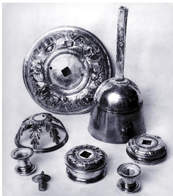
Detalle de la construcción de la pieza.

sobre el pie se sitúa una pieza con volutas en los vértices que completa la forma piramidal. El vástago de los candeleros es de tipo abalaustrado, alternando cuellos cilíndricos y zonas redondeadas, entre las que destaca la manzana muy voluminosa que queda por debajo del platillo y el nudo de pera invertida situado casi en la unión con el pie. El mechero es cilíndrico y está moldurado en los extremos, engrosando especialmente la base, lleva también una cinta plana en el centro y asienta sobre un platillo circular de borde encañonado. La cruz lleva el mismo nudo, sosteniendo una plataforma circular sobre la que asienta aquélla. La cruz es de brazos rectos, perfilados con una línea de contorno cincelada, tienen cornisa en el