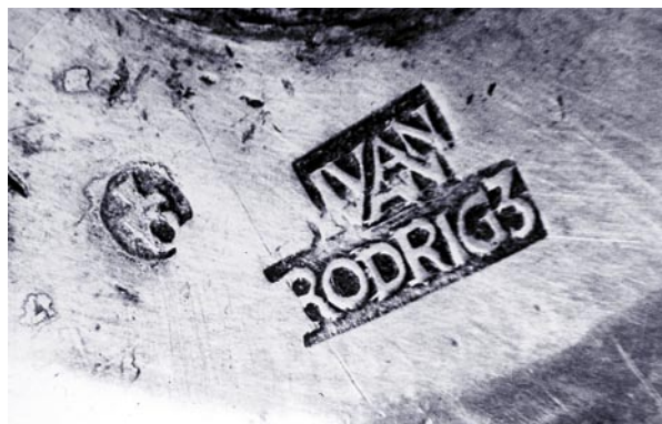
Detalle de las marcas del Cáliz.

Las tres piezas tienen en común el mismo pie tronco-piramidal, formado en su perfil por tres tornapuntas en ese prismáticas, adornadas con tallos de acanto y alzadas sobre garras felinas, mientras las secciones que las unen llevan en el borde inferior dos ces confrontadas y el emblema de la ciudad;