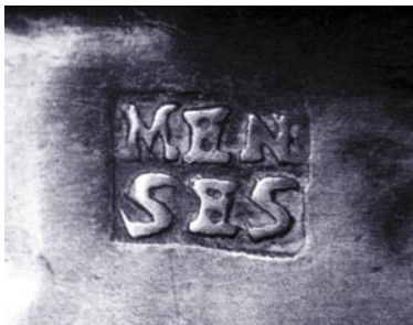
Detalle de las marcas de las urnas de votación.

La estructura de las urnas es muy sencilla y los elementos que la constituyen proceden de la geometría propia del manierismo de fines del siglo XVI, cuyos perfiles transforman el barroco de la centuria siguiente con pesadas curvas, sustituyendo los escalonados en arista viva por suaves molduras.