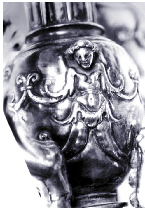
Decoración del nudo de las mazas.

Las figuras sedentes que van alojadas en el templete que remata la cabeza de las mazas, deben ser los dos reyes-emperadores que la ciudad de Toledo utiliza a menudo como emblema heráldico.