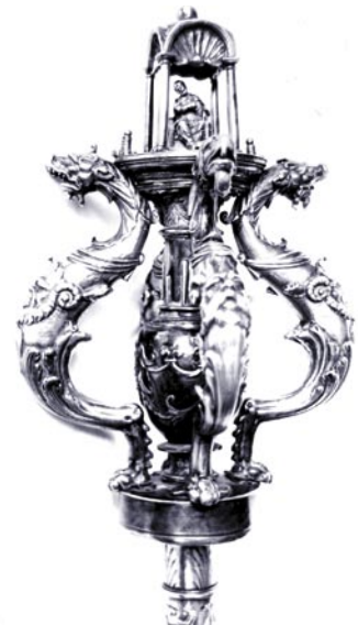
Detalle de la cabeza de las mazas.

En la documentación municipal, el propio Ávila menciona que las mazas «fueron rematadas en él», lo que indica que el go-