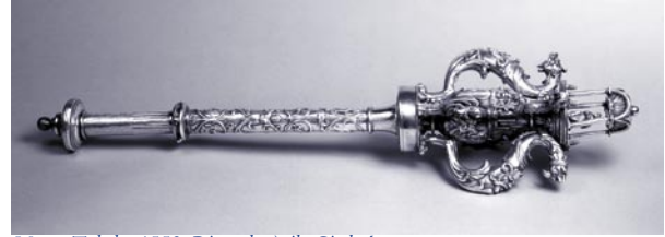
Maza. Toledo, 1553. Diego de Ávila Cimbrón.

con cuernos de carnero y crestería de hojas en la cabeza, sobrepuesto a la altura del vientre. Cada maza remata, por último, en un templete de planta cuadrada, con arcos de medio punto y tímpano avenerado, sostenidos por columnas toscanas, y una bola de remate sobre la bóveda; en su interior se sitúa una figura masculina en bulto redondo sentada en un trono: viste túnica, capa ceñida con un broche y una especie de bonete en la cabeza; probablemente sostenía en las manos —ahora no están— el cetro y la espada.