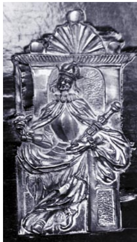
Detalles de las figuras de los reyes-emperadores.