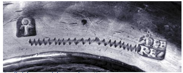
Detalle de las marcas de las urnas de votación.

al del metal precioso con que está hecho, como demuestra el peso considerable que suelen tener. Lo que no significa necesariamente que sean baratos, pues —según los datos conocidos— el precio de la plata en este siglo suele doblar el valor de la hechura pagada al platero. Sólo conozco un ejemplo semejante en la platería europea: Inglaterra, que mantiene tradicionalmente una línea local —calificada a menudo como «burguesa»—, al margen de la corriente decorativa que llega