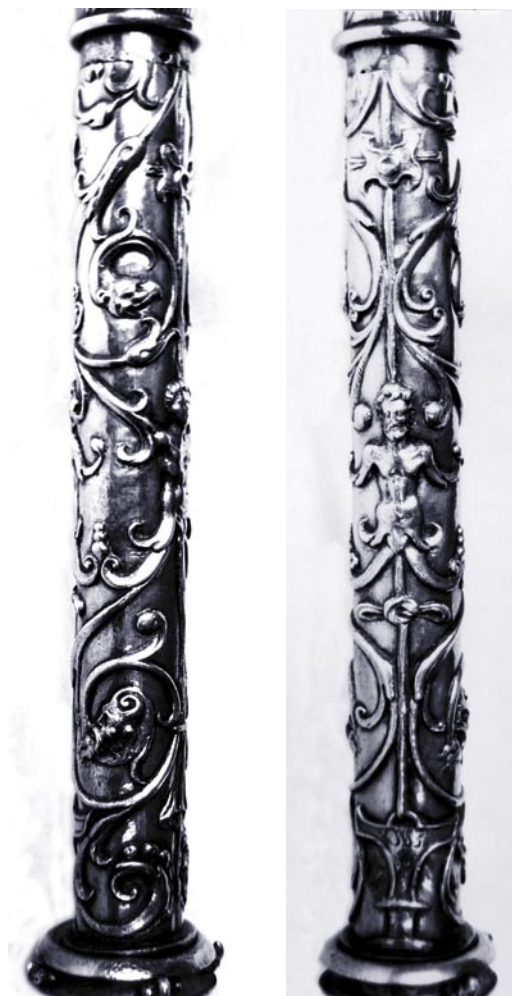
Decoración del cañón de las mazas.

Otras noticias posteriores contenidas asimismo en los documentos del Ayuntamiento nos aportan algunos datos