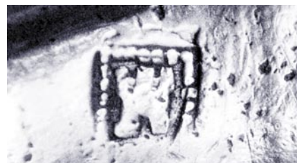
Detalle de las marcas.