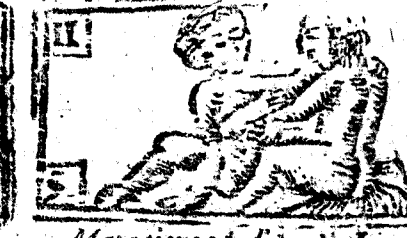
Mayo tiene 31 dias, la Luna 30.

1 Mart. f. Venancio Ob. y mart. 2 Mier. f. Francisco de Paula, y f. Maria Egypciaca. 3 Iuev. f. Vlpiano mart. 4 Vier. f. Ilidoro Arzob. y los Dolores de N. Señora. Anima. * 5 Sab. f. Vicen. Ferrer Predicad. * 6 Dom. de Ramos, y f. Celest. P. y m. 7 Lun. f. Ciriaco, y Comp. ms. 8 Mart. f. Dionisio Ob. 9 Mier. f. Casilda Virgen. 10 Iuev. f. Ezequiel Profeta. 11 Vier. f. Leon Papa. 12 Sab. f. Leon Obispo. 13 Dom. de Pasqua de Resurreccion, y f. Ermenegildo Rey de España. 14 Lun. f. Tibar, y comp. ms. Fiesta. 15 Mart. f. Basilia, y Anastasia Virgenes Fiesta. 16 Mier. f. Engracia Virg. y martyr. 17 Iuev. f. Anizeto Papa, y mart. 18 Vier. f. Eleuterio Ob. y mart. 19 Sab. f. Ermenogenes mart. 20 Dom. de Quasimodo, y f. Inés V Sol en Tauro. 21 Lun. f. Anselmo Arzob. f. Simon, y comp. martyres. 22 Mart. f. Sotero, y f. Cayo P. y ms. 23 Mier. f. Iorge mart. 24 Iuev. f. Dimas, y f. Greg. O. y C. Abstinencia. 25 Vier. f. Marcos Evangelista. Procecion General. 26 Sab. f. Ciero, y Marcel PP. v ms. y la translacion de Santa Leocadia. 27 Dom. f. Anastasio P. y f. Ped. Arzob. m. y Beato Torib. Arzob. de Lima. 28 Lun. f. Vidal mart. y f. Prud. Ob. 29 Mart. f. Pedro Martyr. 30 Mier. f. Catalina de Sena Virg.