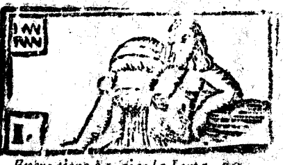
Entre tiene 31 dias la Luna 30.

De los Eclipses de Sol, y Luna. Os Eclipses sucederán este año, vno de Sol, y otro de Luna. El de Sol será a 27. de Enero, no será visible, porque será la conjunction de Sol, y Luna a las 7. y 3. ms. de la tarde, y en este tiempo está el Sol debaxo del Horizonte. El de Luna será en 9. de Julio a las 7. y 46. ms. de la mañana, no será visto, porq la Luna estará debaxo del Horizonte, y no, y otro Eclipse lo observarán los Indios.