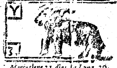
Marçotiene 31 dias, la Luna 30.

1 Sab. f. Ignacio Ob. y f. Brig. Virg. Abstinencia por devocion. 2 Dom. La purificacion de nuestra Señora. 3 Lun. f. Blas Ob. y martyr. 4 Mart. f. Andrés Confine Ob. y C. 5 Mier. f. Agueda Virg. y m. 6 Iuev. f. Dorotea Virg. y martyr. 7 Vier. f. Romualdo Abad. 8 Sab. f. Iuan de Mata fundador, y f. Pam. O. y Comp. ms. * Merida. 9 Dom. de Septuagesima. f. Polonia Virg. y mart. 10 Lun. f. Escolastica Virgen. 11 Mart. f. Saturnino Presb. y comp. martyres. 12 Mier. f. Olalla Virg. y mart. y la primera translacion de S. Eusebio. 13 Iuev. f. Benigno mart. 14 Vier. f. Valentin Presb. y mart. 15 Sab. f. Faustino, y Iovita mart. 16 Dom. f. Iulian, y Comp. mart. 17 Lun. f. Iulian de Capadocia m. 18 Mart. f. Eladio Arzob. de Toledo, y f. Simon Ob. y martyr. 19 Mier. f. Gavino Presb. 20 Iuev. f. Leon Obispo. 21 Vier. f. Felix Obispo. 22 Sab. La Cathedra de S. Pedro en Antioquia, y S. Pscasio Obispo. 23 Dom. f. Marta Virg. y mart. 24 Lun. S. Matias Apostol. * Tend. 25 Mart. f. Cesario Conf. 26 Mier. de CENIZA. f. Alexandro Ob. Abstinencia general en los Conventos de Redempcion de Cautivos. 27 Iuev. f. Leandro Obispo. 28 Vier. f. Roman Abad.