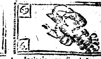
Junio tiene 30 dias, la Luna 29.

1 Iuev. S. Phelipe, y Santiago Apost. * Medelín, y Coria. 2 Vier. f. Atanasio Ob. y Conf. 3 Sab. La Inuencion de la Santa Cruz. 4 Dom. f. Monica viuda. 5 Lun. La Corona de Espinas, y f. Pio. 6 Mart. f. Iuan Ante-Portalatinam. 7 Mier. f. Bitanslao O. y Mart. Abt. 8 Iuev. f. Aparicion de f. Miguel. 9 Vier. f. Gregorio Nacienceno Ob. 10 Sab. f. Antonino Arzob. y Conf. 11 Dom. f. Mamerto Ob. 12 Lun. f. Nereo, y comp. ms. y f. Domingo de la Calzada Conf. 13 Mart. f. Pedro Regal, y f. Ser. O. 14 Mier. f. Bonifacio Mart. 15 Iuev. S. Ildro Labr. patron de Madrid. 16 Vier. S. Vivaldo Ob. y conf. 17 Sab. f. Redituta Virg. y m. y f. Paf. Baylon. 18 Dom. f. Venancio, y f. Felix de Cantalicio. 19 Lun. f. Pedro Coestino, y f. Prudenciana Virgen. 20 Mart. f. Bernardino de Sena LETANIAS. Sol en Geminas. 21 Mier. f. Secundino Martir. LETANIAS. Abstinencia. 22 Iuev. La Ascension del Señor. 23 Vier. f. Iulian Ob. * Zamora. 24 Sab. f. Rebutian, y B. Iuan. Francisco Regis. 25 Dom. f. Urbano Papa, y f. Maria Magdalena de Pazzi. 26 Lun. f. Phelipe Neri Conf. 27 Mart. f. Iuan Papa. 28 Mier. f. Germau Obispo. 29 Iuev. f. Maximiano Ob. 30 Vier. S. Fernando Rey de España. 31 Sab. f. Petronila Virgen. Vigilia.