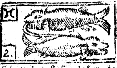
Febrero tiene 28 dias, la Luna 29.

1 Mier. La Circuncion del Señor. 2 Iuev. f. Ilidoro Ob. y martir. 3 Vier. f. Antero Papa, y mart. 4 Sab. f. Aquilino, y comp. martyres. 5 Dom. f. Telesforo Papa, y mart. 6 Lun. La fiesta de los Santos Reyes. 7 Mart. f. Iulian martyr. 8 Mier. f. Seberino, y f. Lauréc. Iustin. 9 Iuev. f. Iulian, y Basilia mart. 10 Vier. f. Nicanor Diacono, y mart. 11 Sab. f. Iginio, y f. Teodosio. 12 Dom. f. Benito Abad, y Conf. 13 Iuev. f. Gumerindo Presb. y m. 14 Mart. el Duice Nombre de Iesvs, y f. Hilario, y f. Felix Presb. y m. 15 Mier. f. Pablo primer Heremitaño, y f. Mauro Abad. 16 Iuev. f. Marcio Papa, y mart. 17 Vier. f. Anton Abad, y Conf. 18 Sab. La Cathedra de San Pedro en Roma, y f. Prisca Vir. y m. Abstin. 19 Dom. f. Canuto Rey de Dania, y f. Mario, y comp. mart. 20 Lun. f. S. bastian, y Fab. mart. 21 Mart. f. Inés Virgen, y mart. 22 Mier. f. Vicente, y Anastasio m. 23 Iuev. f. Ildesonso Arzobispo de Toledo, y f. Raymundo de Peñafort Ob. 24 Vier. N. S. de la Paz, y f. Tim. O. 25 Sab. La Conversion de S. Pablo. 26 Dom. f. Policarpo Ob. y mart. 27 Lun. f. Juan Christo. Ob. y Conf. 28 Mart. f. Iulian, y f. Trifon mart. y aparicion de S. Inés, y Fundacion de la Religion de la SS. Trinidad. 29 Mier. f. Francisco de Sales Ob. 30 Iuev. f. Martina Virg. y mart. 31 Iuev. f. Ped. Nolas. fund. y f. Ciriaco.