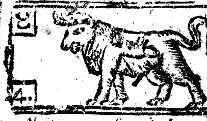
Abril tiene 30 dias, la Luna 29.

1 Sab. El Angel de la Guarda, y S. Leon mart. * Guadalaxara. 2 Dom. f. Lucio Obispo. 3 Lun. f. Hemeterio, y Celed. her. 4 Mart. f. Casimiro Confessor, y S. Lucio Papa, y m. Anima. * 5 Mier. f. Euseb. y com. ms. Tempora. 6 Iuev. f. Victor, y comp. mart. 7 Vier. f. Thomas de aquino. f. Perp. y S. Felicitas Mart. 8 Sab. f. Iulian Arzob. de Toledo, y S. Juan de Dios. Tempora. 9 Dom. f. Francisca viuda, y f. Catalina de Bolonia Virgen. 10 Lun. f. Meliton, y 39. comp. mar. 11 Mart. f. Eulogio Presb. y mart. 12 Mier. f. Gregorio Papa. 13 Iuev. f. Rodrigo, y Salomon ms. 14 Vier. f. Matilde Reyna. 15 Sab. f. Longinos martyr. Anm. * 16 Dom. f. Iulian, y f. Patricio Ob. Anima. * 17 Lun. f. Patricio Ob. y Conf. 18 Mart. f. Gabriel Arcangel, y f. Nauciso Obispo, y m. 19 Mier. S. Joseph Patriarca. 20 Iuev. f. Ioaquin Confes. 21 Vier. f. Benito Abad. 22 Sab. f. Deogracias Ob. 23 Dom. f. Vitor. y cop. m. Anima * 24 Lun. f. Agapito Obispo. 25 Mart. La Anunciacion de N. Señora, y Encarnacion del Hijo de Dios. 26 Mier. f. Montano, y Maxima ms. 27 Iuev. f. Ruperto Obispo. 28 Vier. f. Casio, y Doroteo ms. 29 Dom. f. Iuan Climaco Abad. 30 Lun. f. Baibina Virgen.