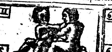
Mayo tiene 31. dias, la Luna 30.