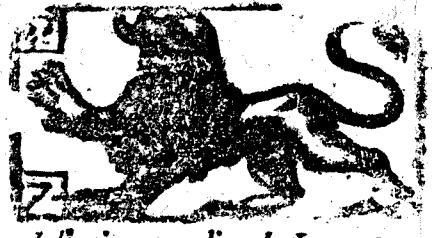
Julio tiene 31. dias, la Luna 30.