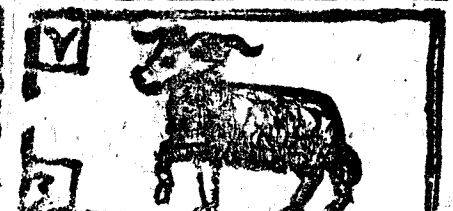
Março tiene 31. dias, la Luna 30.

1 Sab. f. Ignacio Obisp. y m. y santa Brigida virgen. Abstinencia por devocion. 2 Dom. La Purificacion de N. Señora. Ay Proçesion general. 3 Lun. f. Blas Ob. y mart. 4 Mart. f. Andrés Corlino Ob. 5 Mier. santa Agueda virg. y mart. 6 Iuev. santa Dorotea v. y m. Quart. crec. à las 9. y 18. ms. de la noç. en Taur. seco. y vici. fuerz. 7 Viern. f. Romualdo Abad. 8 Sab. f. Iuan de Mata Fund. y f. Pablo Ob. y comp. martires. * Merida. 9 Dom. santa Polonia v. y mart. 10 Lun. santa Escolastica virg. 11 Mart. f. Saturnino Presb. y comp. mart. * Berlanga. 12 Mier. f. Olalla v. y m. y la Primera Translacion de f. Eugenio. 13 Iuev. f. Benigno mart. Luna llen. y Eclipsad. à las 10. y 55. ms. de la noç. lluvias interperoiadas con nieve. 14 Vier. f. Valentin Presb. y mart. 15 Sab. san Faustino, y Iovita ms. 16 Dom. Septuagesima. san Iulian, y comp. ms. * Medina del Campo. * Anima. 17 Lun. f. Iulian de Capadocia m. 18 Mart. f. Eladio Arçob. de Toledo, y f. Simeon Ob. y mart. 19 Mier. f. Gavin, Presb. Sol en Piscis. 20 Iuev. f. Leon Ob. Quart. meng. à la 1. y 51. ms. del dia, en Sagitar. sol entre obscuras nubes y frio. 21 Viern. f. Felix Ob. 22 Sab. La Cated. def. Pedro en Antioquia, y f. Pasçasio Ob. Vigilia. 23 Dom. f. Marta V. y M. 24 Lun. S. Matias Apostol. * Tendilla. 25 Mart. f. Cesarino conf. 26 Mier. f. Alexandro Ob. 27 Iuev. f. Leandro Ob. 28 Viern. f. Roman Abad. Lun. nuev. y Eclipse de Sol visible, à las 12. y 50. ms. del dia, en Piscis. humedo, y sereno en partes.