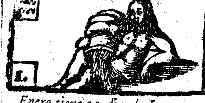
Enero tiene 31. dias, la Luna 30.

Inizio del Año. Ten vendida sea para todos los vivientes la dulce Estacion de la Primavera, coronada de jazmines, rosas, y azucenas, sembrando nacares de aliofar sobre las entretejidas, y bordadas sombras de la discreta Palas. Por cuyo