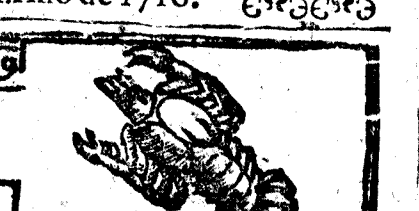
Junio tiene 30. dias, la Luna 29.