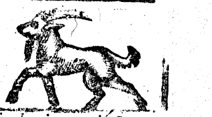
Diciembre tiene 31. la Luna 30.