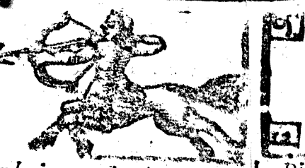
Noviembre tiene 30. dias, la Luna 29.