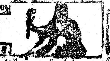
Agosto tiene 31. dias, la Luna 30.