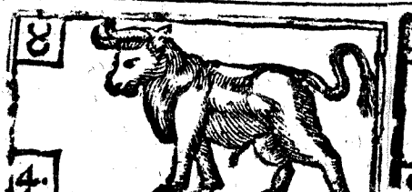
Abril tiene 30. dias, la Luna 29.