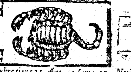
Octubre tiene 31. dias, la Luna 30.