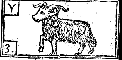
Março tiene 31. dias, la Luna 30.