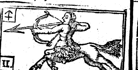
Noviembre tiene 30. dias, la Luna 29.