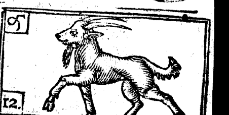
Diciembre tiene 31. la Luna 30.