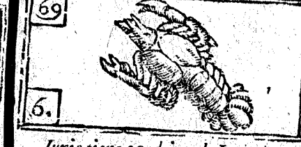
Junio tiene 30. dias, la Luna 29.