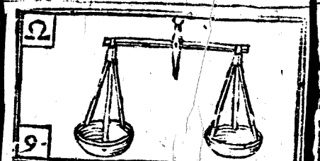
Septiembre tiene 30. dias, la Luna 29.