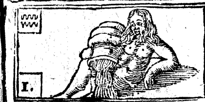
Enero tiene 31. dias, la Luna 30.