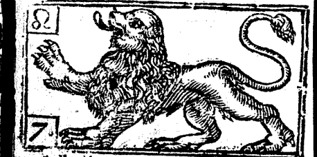
Julio tiene 31. dias, la Luna 30.