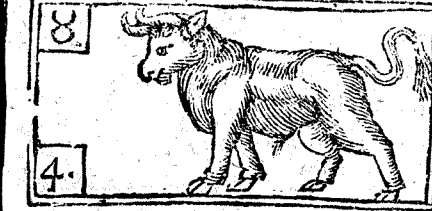
Abril tiene 30. dias, la Luna 29.