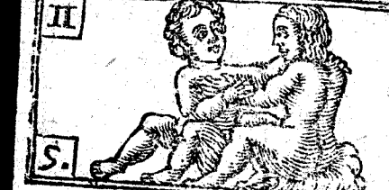
Mayo tiene 31. dias, la Luna 30.