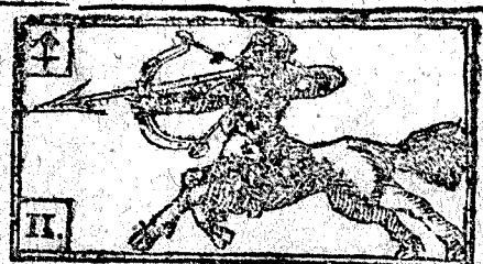
Noviembre tiene 30. dias, la Luna 29.

Luna nueva à las 1. y 37. ms. de la tarde. en Escorp. vient. fres.