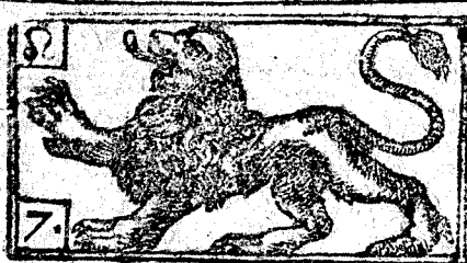
Julio tiene 31. dias, la Luna 30.

1 Mir. f. Casio, y Secúndino Ob. y m. 2 Mier. la Visitation de N. Señora, y f. Proceso, y Martiniano ms. 3 Luna nuev. à las 2. y 43. ms. de la mañ. en Canc. calor, y truen. 4 Iuev. d. Marcos, y comp. ms. 5 Vier. f. Isabel Reina de Portugal, y f. Laureano Arç. de Sevilla, y m. 6 Sab. Santa Zoe martir. 7 Dom. Santa Lucia martir. 8 Lun. f. Claudio, y compañeros ms. 9 Mar. f. Margarita viuda, Reina de Escocia, y f. Aguilá, y Priscila ms. 10 Mier. f. Cirilo Obispo, y m. 11 Iuev. los Siete Hermanos ms. y Santa Rufina, y Segunda ms.