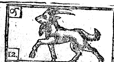
Diciembre tiene 31. dias, la Luna 30.

Luna nueva à las 4. y 38. ms. de la tarde. en Capricornio, vientos, y frios.