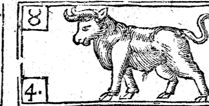
Abril tiene 30. dias, la Luna 29.

1 Sab. el Angel de la Guarda, y san Leon, y compañeros mart. 2 Dom. f. Lucio Obisp. Anim. * 3 Lun. f. Hemeter, y Celed. herm. ms. 4 Mart. f. Calixto confessor, y san Lucio Papa, y martir. 5 Mier. f. Eusebio, y comp. ms. 6 Luev. f. Victor, y compañeros ms. 7 Vier. Santo Tomás de Aquino, f. Perperua, y santa Felicitas ms. 8 Sab. f. Julian Arçobispo de Toledo, y San Juan de Dios conf. 9 Dom. S. Francisca viuda Romana. 10 Lun. f. Meliton, y 39. comp. ms. 11 Mart. f. Emigdio Presbyt. y m. 12 Mier. f. Gregorio Papa, y conf. 13 Luev. f. Salomon ms. 14 Vie. N. Señora de los Siete Dolores, y santa Matilde Reina. * 15 Sab. san Loaginos martir. * 16 Do. Ram. f. Julia m. y f. Patrie. Ob. 17 Lun. f. Patricio Ob. y confes. 18 Mart. f. Gabriel Arcangel, y san Narciso Obispo, y m. 19 Mier. San Joseph Patriarca. 20 Luev. San Ioachim confessor, y san Benito Abad. 21 Viern. san Benito Abad. 22 Sab. f. Degracias Obispo. 23 Dom. Pascua de Resurreccion, y san Esteban, y comp. ms. 24 Lun. san Agapito Obisp. 25 Mar. la Anunciacion de N. Señora, y Enarnacion del Hijo de Dios. 26 Mier. f. Monsano, y Maxima ms. * 27 Luev. f. Ruperto Obispo, y conf. 28 Vier. f. Castor, y Doroteo ms. 29 Dom. f. Segundo martir. 30 Lun. f. Iuan Climaco Ab. Abrense las Velaciones. 31 Lun. f. Balbina virgen.