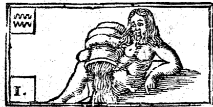
Enero tiene 31. dias, la Luna 30.

Apacible senos ofrece la deleytosa Primavera à los 20. de Março, hor. 12 y 24. ms. del dia, anunciando en sus flores lo sazonado de los frutos, con variedad de dias serenos, lluvias, y vientos. La cosecha del trigo, será competente, del