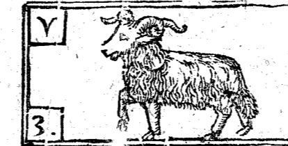
Março tiene 31. dias, la Luna 30.

1 Viern. f. Ignacio Obispo, y m. y tanta Brigidavirgen. Absltn. 2 Sab. La Purificacion de N. Señora. 3 Dom. f. Blas Obispo, y m. 4 Lun. f. Andrés Corsino Obisp. 5 Mar. santa Agueda virg. y mrt. 6 Mier. santa Dorotea v. y m. 7 Luev. san Romualdo Abad. 8 Viern. f. Juan de Mata, Fundador, y san Pablo Obispo, y comp. mart. 9 Sab. santa Polonia virgen, y m. 10 Do. santa Escolastica v. Zamora 11 Lun. san Saturnino Presbitero, y comp. martires. * Berlanga. 12 Mart. santa Olalla virg. y m. y la Primera Translac. def. Eugenio. 13 Mier. f. Benigno m. Temp. 14 Luev. f. Valentin Presbitero, y m. 15 Vier. f. Faustino, y Iovita ms. Temp. 16 Sab. f. Julian, y comp. ms. Temp. 17 Dom. f. Julian de Capadocia m. 18 Lun. f. Eladio Arçobispo de Toledo, y f. Simeon Obispo, y m. 19 Mart. f. Gavino, Presbyt. y m. 20 Mier. san Leon Obispo. 21 Luev. san Felix Obispo. 22 Vier. la Catedral de S. Pedro en Antioquia, y san Pascasio Obispo. 23 Sab. santa Marta v. y m. Vig. 24 Dom. Pacante. Anima. * 25 Lun. San Matias Apóstol. 26 Mar. f. Cesario confes. 27 Mier. f. Alexandro Obispo. 28 Luev. san Leandro Obispo. 29 Viern. f. Roman Abad.