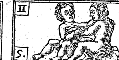
Mayo tiene 31. dias, la Luna 30.

1 Mart. Venancio Ob. y m. 2 Mie. san Francisco de Paula, y santa Maria Egipciaca. 3 Luev. san Vulpiano martir. 4 Vier. f. Isidoro Arçob de Sevilla. 5 Mier. f. Vicente Ferrer Predicad. 6 Dom. f. Celestino Papa, y m. 7 Lun. f. Ciriaeo, y comp. ms. 8 Mart. f. Dionisio Obispo. 9 Mier. santa Casilda v. 10 Luev. f. Ezequiel Profeta. 11 Vier. san Leon Papa, y Conf. 12 Sab. san Zenon Obispo, y mart. 13 Do. f. Ermenegildo Rey de Españ. 14 Lun. f. Tiburcio, y comp. ms. 15 Mart. santa Basilisa, y Anastasia martires. 16 Mier. santa Engracia virg. y m. 17 Luev. f. Aniceto Papa, y m. 18 Vier. san Eleuterio Obispo, y m. 19 Sab. f. Hermogenes, y comp. ms. 20 Dom. santa Inés virgen. 21 Lun. f. Anselmo Arçobisp. y conf. y san Simon, y compañeros ms. 22 Mart. f. Soter, y Cayo, P. P. y ms. 23 Mier. San Jorge martir. 24 Luev. f. Gregorio Obisp. y conf. 25 Vier. san Marcos Evangelista. 26 Sab. f. Cleto, y Marcelino, Papas, y ms. y Transl. de santa Leocadia. 27 Dom. f. Urbano Papa, y mart. y santa Maria Magdalena de Patris. 28 Lun. Felipe Neri confes. y san Eleuterio Papa, y martir. 29 Mart. f. German Obisp. 30 Lun. f. Vidal m. y f. Prudencio Obispo. 31 Mier. f. Catalina de sena v. Absl.