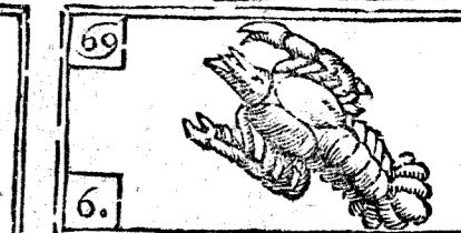
Junio tiene 30. dias, la Luna 29.

1 Luev. La Ascension del Señor, y San Felipe, y Santiago Apóstol. 2 Vier. san Atanasio Obisp. y conf. 3 Sab. la Invenion de la Santa Cruz. 4 Dom. santa Monica viuda. 5 Lun. la Corona de Espinas, y san Sacerdote Obispo de Sigüenza. 6 Mar. S. Iuan AntePortam Latinam. 7 Mier. f. Estanislao Ob. y m. Absl. 8 Luev. la Aparic. de S. Miguel Arcæg. 9 Vier. f. Gregorio Nacianceno. 10 Sab. f. Antonino Arçob. y conf. y f. Gordiano, y Epimacho ms. Vig. 11 Dom. Pascua de Espiritu Santo, y san Mamerto Ob. y Zamora. 12 Luev. f. Nereo, y Achileo, y comp. ms. 13 Mart. f. Pedro Regalados conf. y san Sernacio Obispo. 14 Mier. f. san Bonifacio m. Temp. 15 Luev. f. Isidro Labrador. * 16 Vier. f. Vba do Ob. y conf. Temp. 17 Sab. santa Restituta virg. y m. y san Pascual Baylon conf. Temp. 18 Dom. La Santissima Trinidad, y san Venancio, y f. Felix ms. 19 Lun. f. Pedro Celestino Papa, y santa Pudenciana virgen, y m. 20 Mart. f. Bernardino de Sena conf. 21 Mier. f. Secundino m. Sol en Gem. 22 Luev. Corpus Christi, f. Quiterio v. y m. y f. Rita vind. Procef. gener. 23 Vier. f. Julian, y compañeros ms. 24 Sab. san Robustiano martir. 25 Dom. f. Urbano Papa, y mart. y santa Maria Magdalena de Patris. 26 Lun. Felipe Neri confes. y san Eleuterio Papa, y martir. 27 Mart. f. Iuan Papa, y m. 28 Mier. f. German Obisp. 29 Luev. f. Maximo Obisp. 30 Viern. Fernando Rey de España, y san Felix Papa, y martir. 31 Lun. santa Petronila virgen.