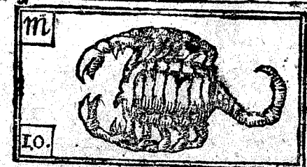
Octubre tiene 31. dias, la Luna 30.

Luna nueva à las 12. y 55. ms. de la noche. en Virgo, fres. y humed.