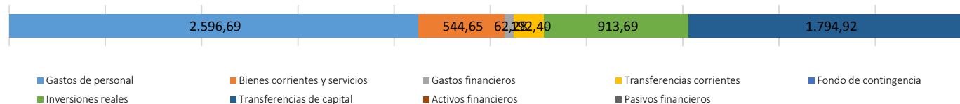
Detalle de los aumentos por Capítulos de gasto